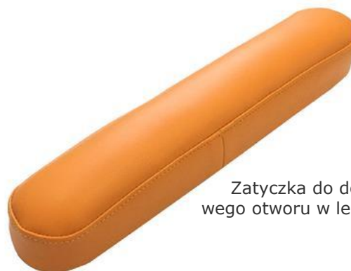
Zatyczka do dodatkowego otworu w leżysku