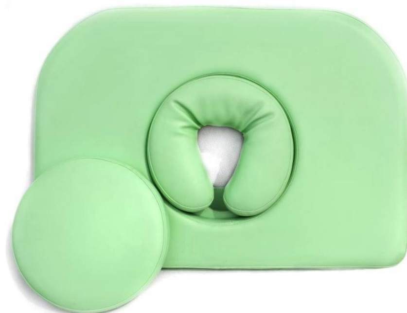
Okrągłe wycięcie w zagłóweku z miękką poduszką i zatyczką