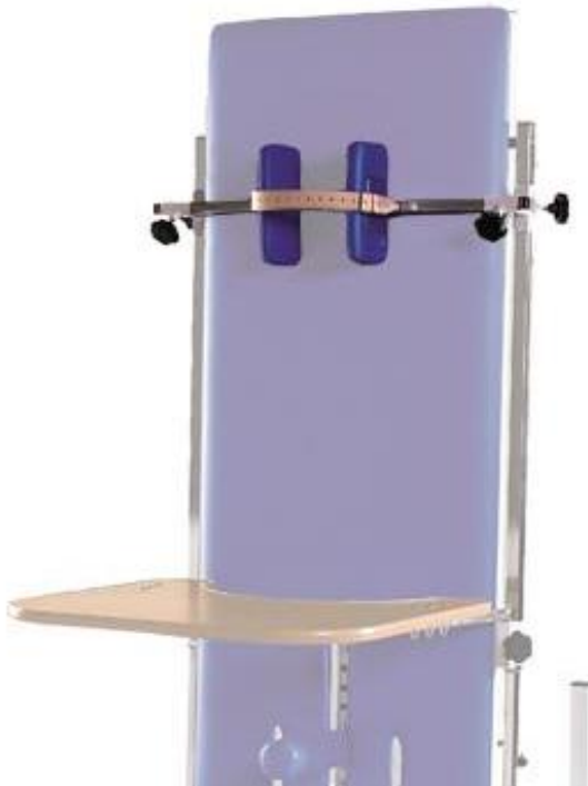
Pufki z paskiem do stabilizacji głowy