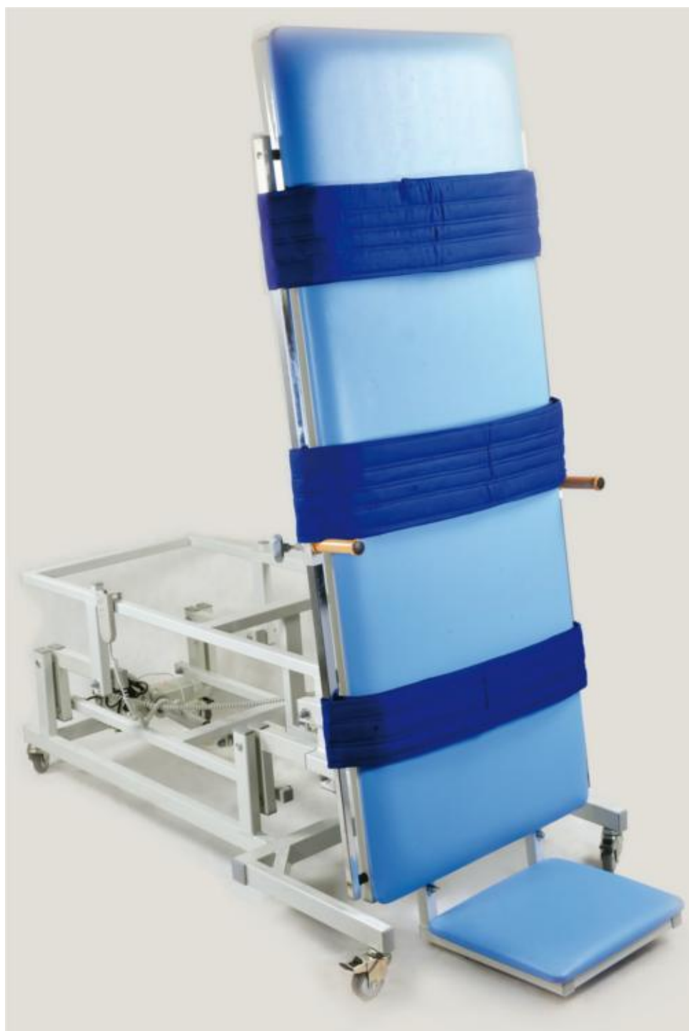
Stół rehabilitacyjny do pionizacji SP-2 z 3 pasami stabilizującymi (na klatkę piersiową, biodra, nogi)