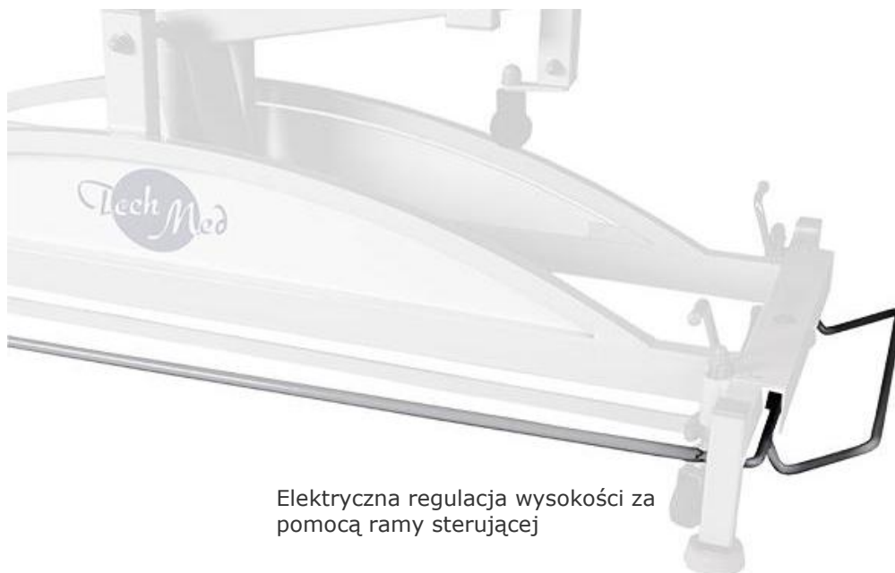
Elektryczna regulacja wysokości za pomocą ramy sterującej