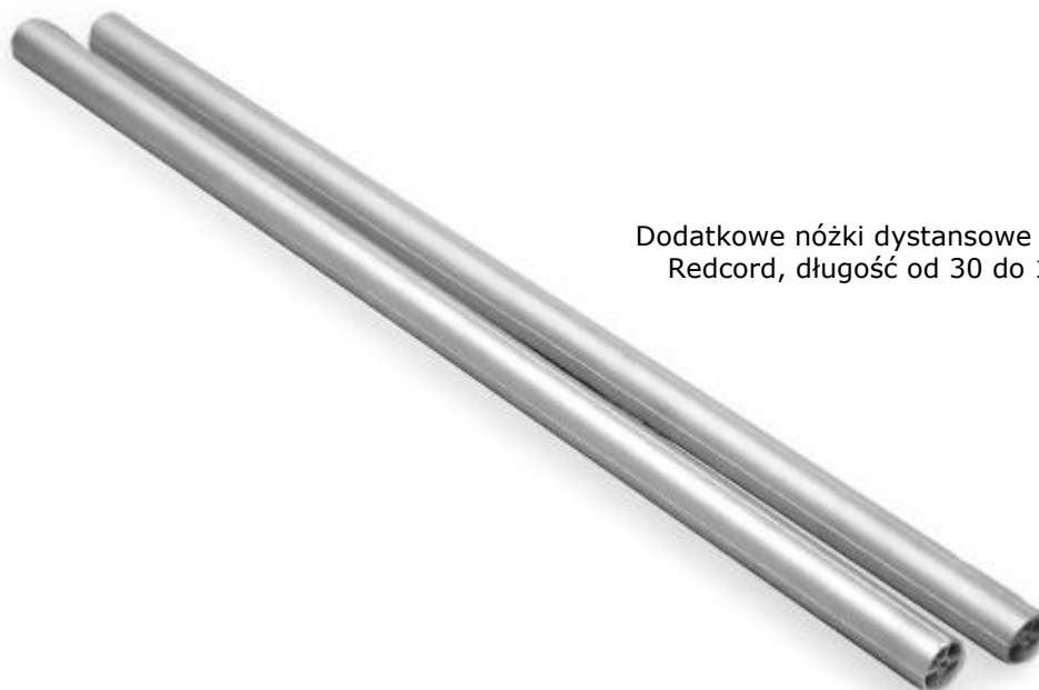
Dodatkowe nóżki dystansowe do konstrukcji sufitowych Redcord, długość od 30 do 120 cm

Maksymalna wysokość pomieszczenia dla pojedynczych aparatów to 427 cm, a dla konstrukcji sufitowej 360 cm. W przypadku wyższych pomieszczeń zalecamy klientom rozważenie następujących rozwiązań: 1. Zakup konstrukcji wolnostojącej lub przyściennej (montaż konstrukcji przyściennej tylko do ściany nośnej, zapewniającej stabilność całej instalacji) 2. Montaż we własnym zakresie konstrukcji umożliwiającej zainstalowanie zestawu REDCORD w pomieszczeniu.