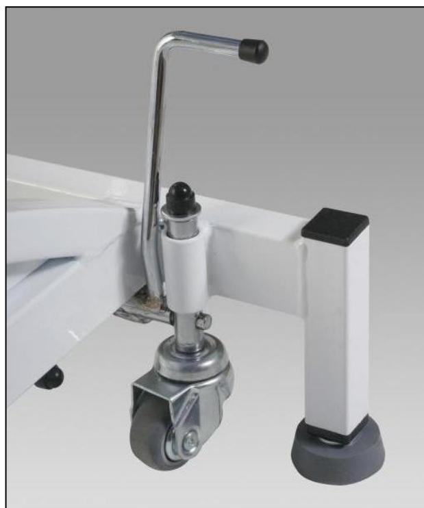
Układ jezdny z hamulcem centralnym