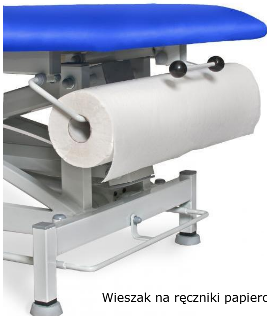
Wieszak na ręczniki papierowe