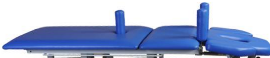
Banany stabilizujące barki i kończyny dolne