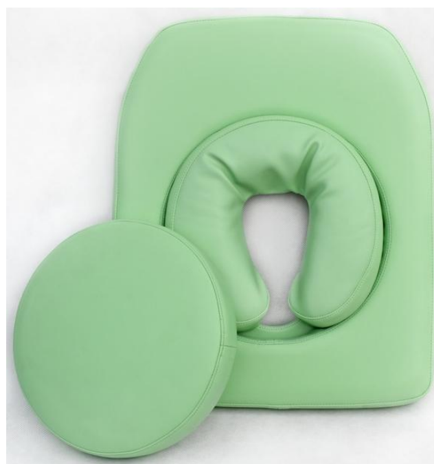
Okrągłe wycięcie w zagłówku z miękką poduszką i zatyczką