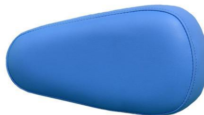
Zatyczka do standardowego otworu w zagłówku w kształcie gruszki