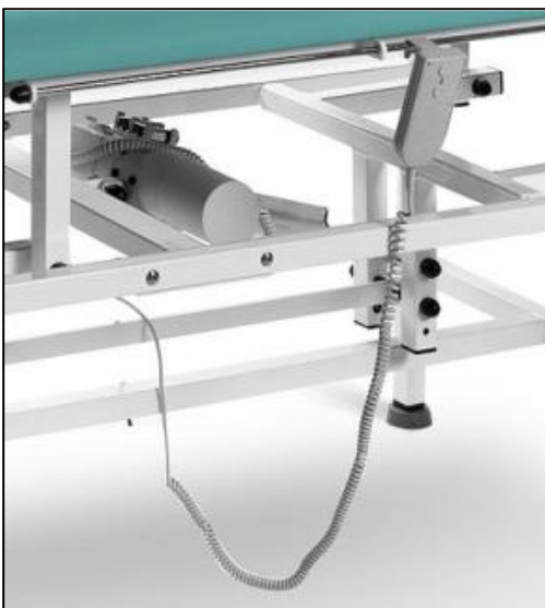
Elektryczna reg. wys.