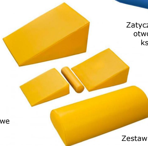
Zestaw kształtek do masażu