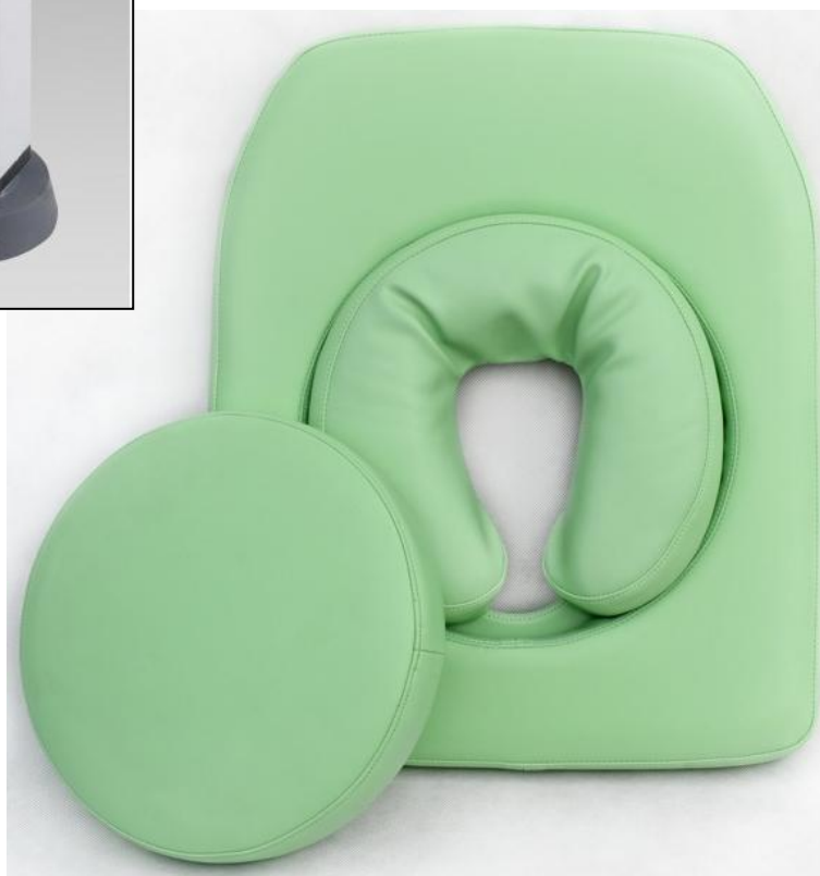
Okrągłe wycięcie w zagłówku z miękką poduszką i zatyczką