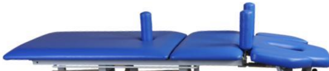
Banany stabilizujące barki i kończyny dolne