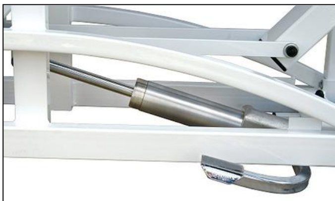
Hydrauliczna regulacja wys.