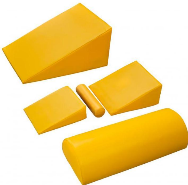
Komplet kształtek do masażu