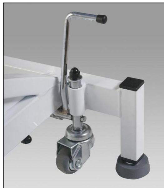
Kółka jezdne z hamulcem centralnym