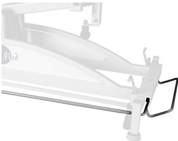
Regulacja wysokości za pomocą ramy sterującej